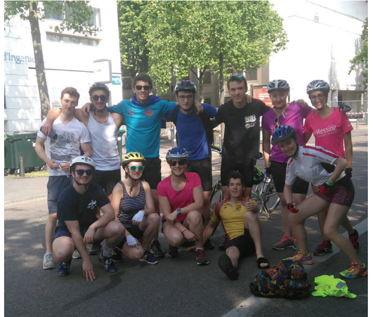
Les 12 participants au matin du 25 mai devant l'Ecole.